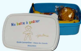
Boîtes à goûter