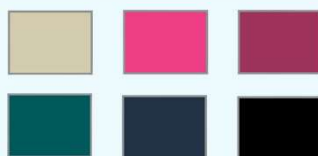
Sac à dos coton : écru, rose, rouge claret, pétrole, bleu nuit, noir