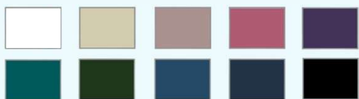
Tote bag : blanc, naturel, marron taupe, cassis, violet purple, pétrole, vert bouteille, bleu indigo, gris anthracite, noir, bio