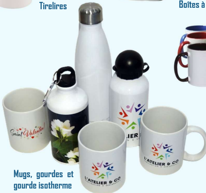
Mugs, gourdes et gourde isotherme