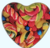
Boîte aluminium cœur

Pour un résultat étincelant aux teintes parfaites. Idéal en toute occasion, et la communication facile par l'objet.