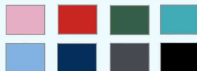
Sac à dos 100 % polyester : rose, rouge, vert bouteille, turquoise, bleu, bleu marine, gris foncé et noir

Pour un résultat élégant en version monochrome. Pour être fier de porter vos propres créations artistiques.