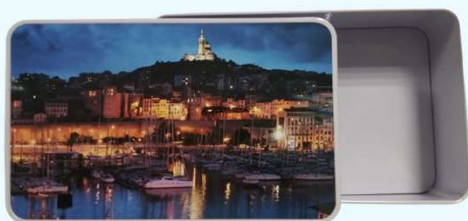
Boîte aluminium rectangulaire